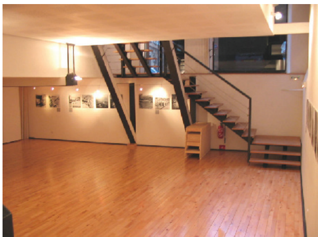
AUDITORIUM 116 m 2