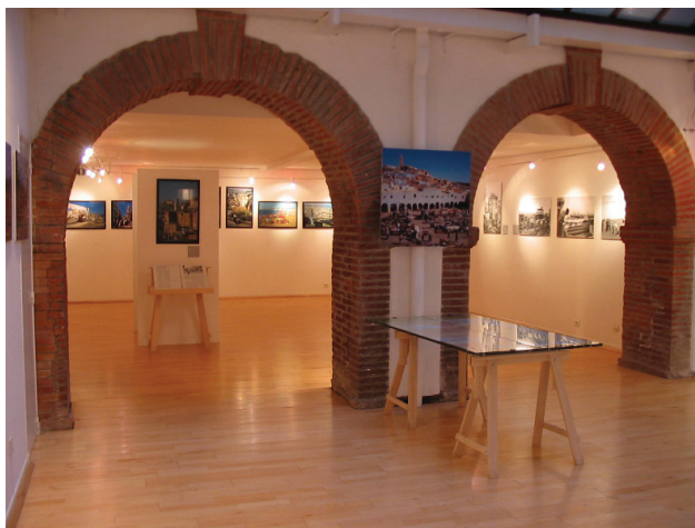
SALLE 2 + 3 87,5 m 2

A deux pas du Capitole, le Centre Méridional de l'Architecture et de la Ville vous propose ses espaces pour organiser vos rencontres, séminaires, réunions, etc.